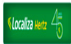
image001.jpg 6 KB