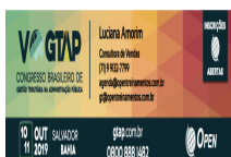
image002.jpg 60 KB