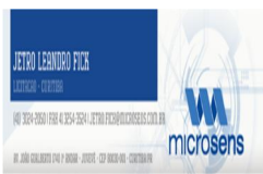
image001.png 56 KB