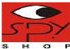
image001.png 4 KB