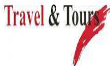
image001.jpg 3 KB