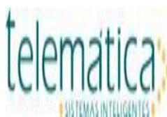
image001.jpg 3 KB