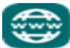
image002.png 2 KB