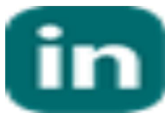
image004.png 1 KB